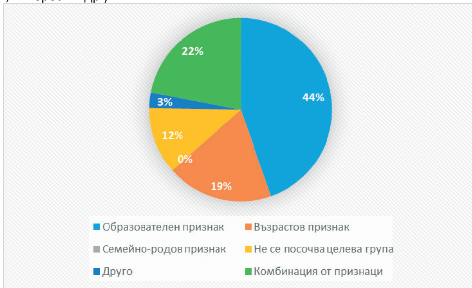
Фигура 5. Целеви групи

Ако образователната програма е насочена към неформалното образование, т.е. привличане на аудитория по желание в свободното време, то тогава целевите групи следва да бъдат подбрани по други критерии (възраст, интереси и др.).