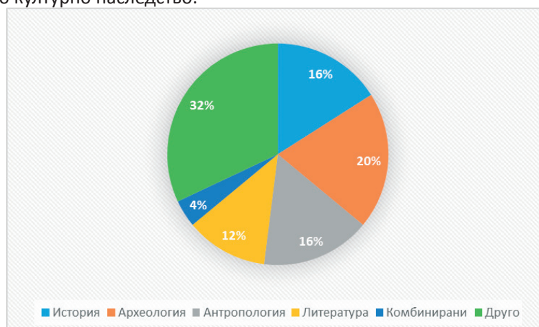
Фигура 3. Отношение на образователните програми към определена научна област

Интересна констатация, поради фактът, че музеите най-вече се свързват с материалното движимо културно наследство е, че в проучените образователни програми и инициативи на второ място с дял от 21% се определя връзката им с етнографията на България. Тази научна област има пряко отношение към обичаите, традициите, вярванията, бита и занаятите, които са елемент от нематериалното културно наследство 5 . В следствие на това може да се определи, че музейната среда има изключителна роля за неговото опазване и популяризирането му, най-вече сред подрастващото поколение. Откриват се и примери които имат отношение към архитектурата, географията, биологията, теологията и музеологията. Най-висок относителниен дял (34%) на музейните образователни програми се отчита към опознаването на материалното движимо културно наследство.