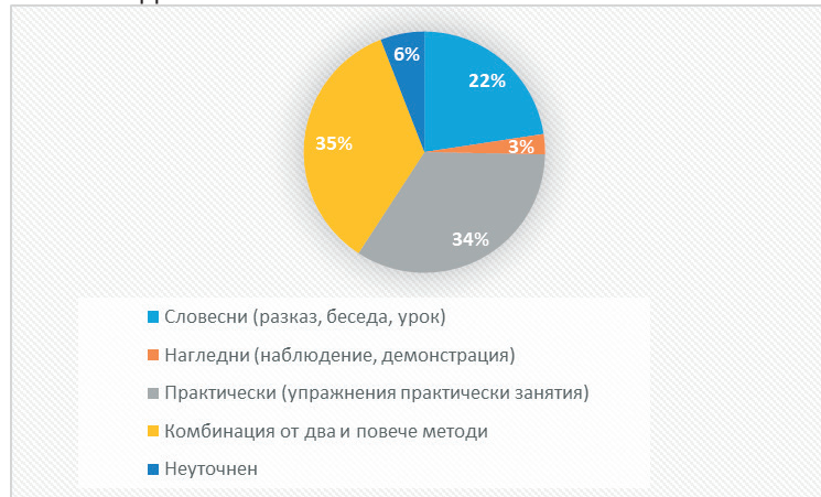
Фигура 2. Група методи, към която имат отношение образователните програми

практически (упражнения, практически занятия). В допълнение се конкретизира и формата им на провеждане, според доказаната класификация в музейната [2] а именно: беседа, урок, презентация, ателие, игра, състезание и др. (фиг. 2). В категория „Други“ се открояват интересни дейности, като: фотоконкурс с изложба; посещения на обектите на културно-историческото наследство в областта; разглеждане на експозиция, събиране и обработване на материали от известни родове в града, след което участниците подкрепят изложба и др. В случаите, при които се организира състезание в музея, то винаги е съчетано и с други форми на образователни дейности.